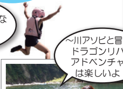
~川アソビと冒険~ ドラゴンリバー アドベンチャー は楽しいよ!