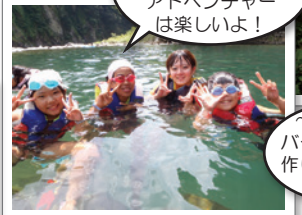
~森アソビ~ バームクーヘン 作りやクラフト も作るよ