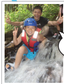
山々や川 などいろいろな 自然の中で アソボーヤ!