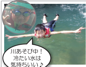
川あそび中! 冷たい水は 気持ちいい!