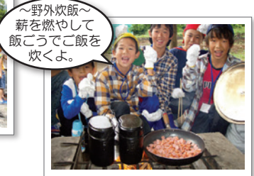
~野外炊飯~ 薪を燃やして 飯ごうでご飯を 炊くよ。