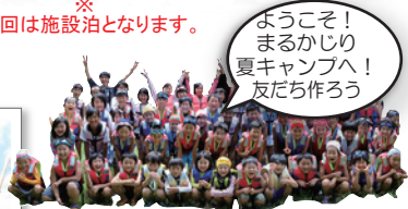
ようこそ! まるかじり 夏キャンプへ! 友だち作ろう