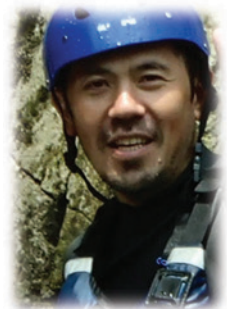
日本アルクス自然学校 校長

おうちの人と離れて、見知らぬ場所で見知らぬ人と生活するので自分のことは自分でしないといけません。勇気とチャレンジの心を持っていないとおもしろくないし、友達もできないかもしれません。キャンプ・合宿なので、おうちや日常生活では当たり前なのが当たり前ではなく不便だし、集団行動なので「わがまま」や個人主義は通用しません。