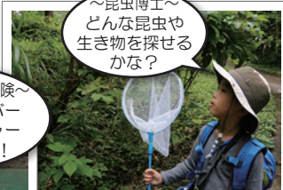
~昆虫博士~ どんな昆虫や 生き物を探せる かな?